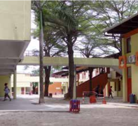
Lycée Montaigne, Cotonou, Bénin

Cahier d'histoires #3 est une création croisée et transfrontalière entre Afrique et Europe.