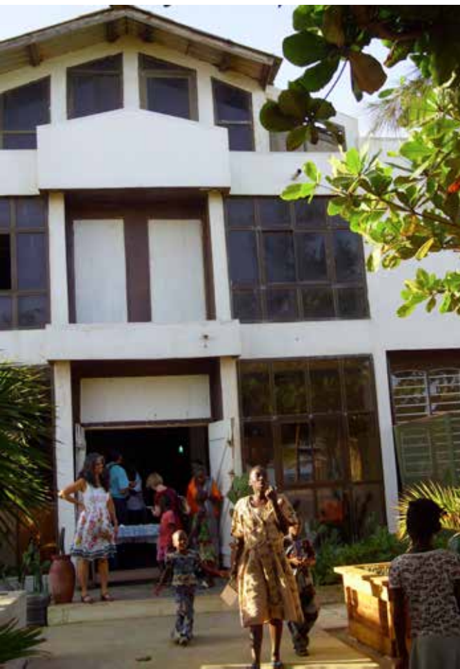
Le lieu de création Studio-Théâtre, sur la route des pêches, Togbin Daho, Bénin